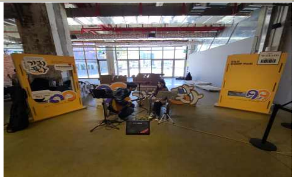
행사장 내부 예시