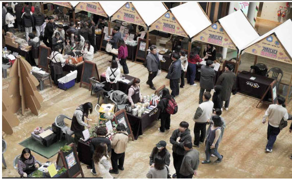
행사장 내부 예시