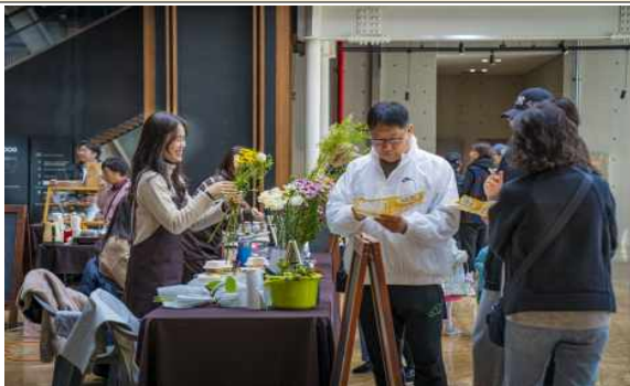
행사장 내부 예시