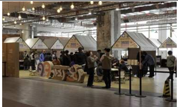
행사장 내부 예시