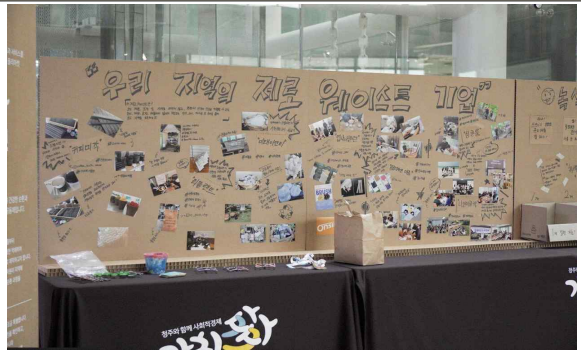
행사장 내부 홍보물 예시